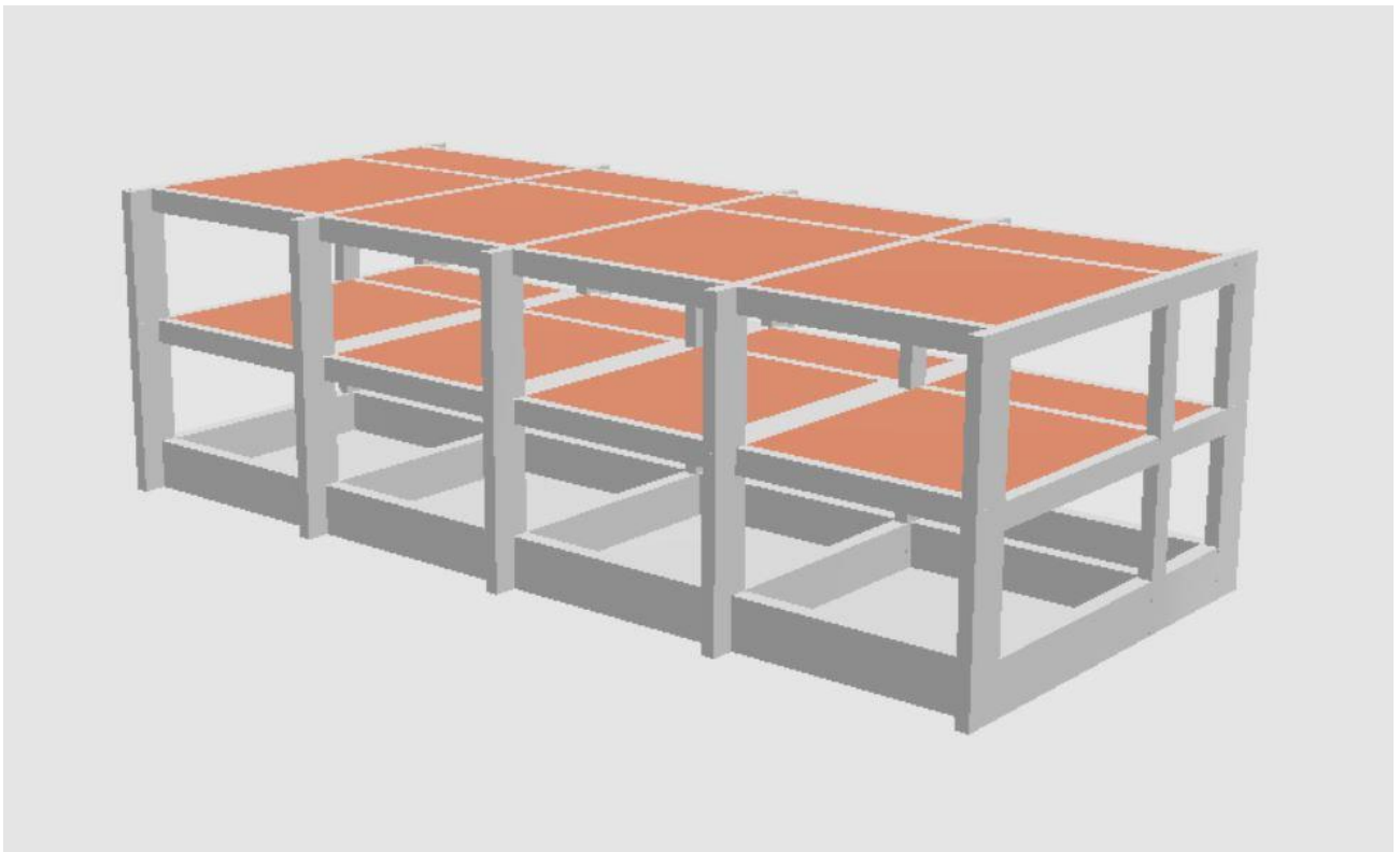
Figura 2: Vista Assonometrica Posteriore Generale della Struttura - “Corpo B”